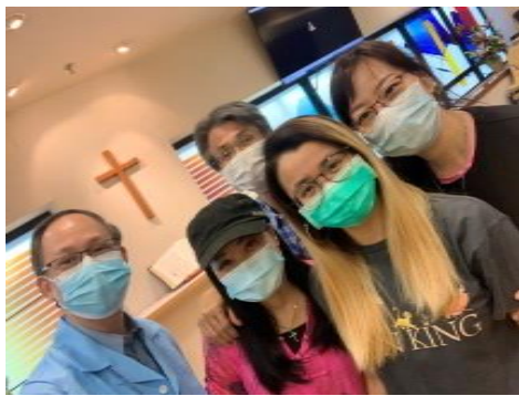
康復後的晴希探望那打素醫院院牧，表達謝意