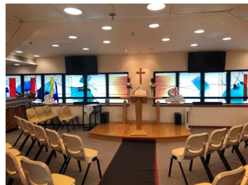
雅麗氏何妙齡那打素醫院小教堂