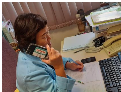
那打素醫院院牧增設「病人熱線」，即時提供心靈支援