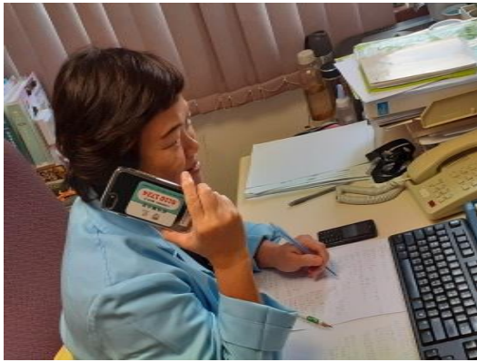
那打素醫院院牧增設「病人熱線」，即時提供心靈支援