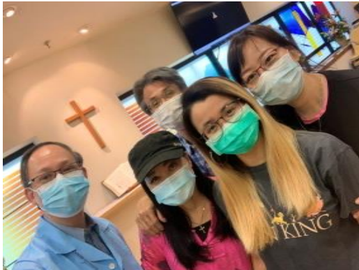
康復後的晴希探望那打素醫院院牧，表達謝意