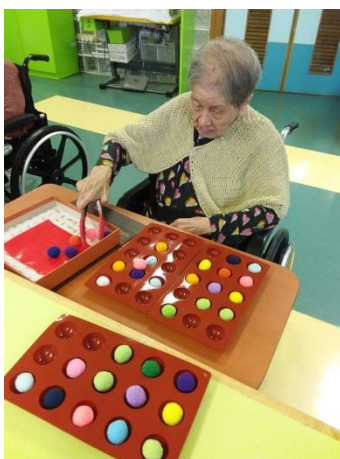
▲ 「夾球」是傳統復康訓練之一