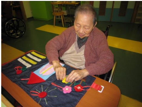
▲ 圖畫拼貼訓練院友的手眼協調功能