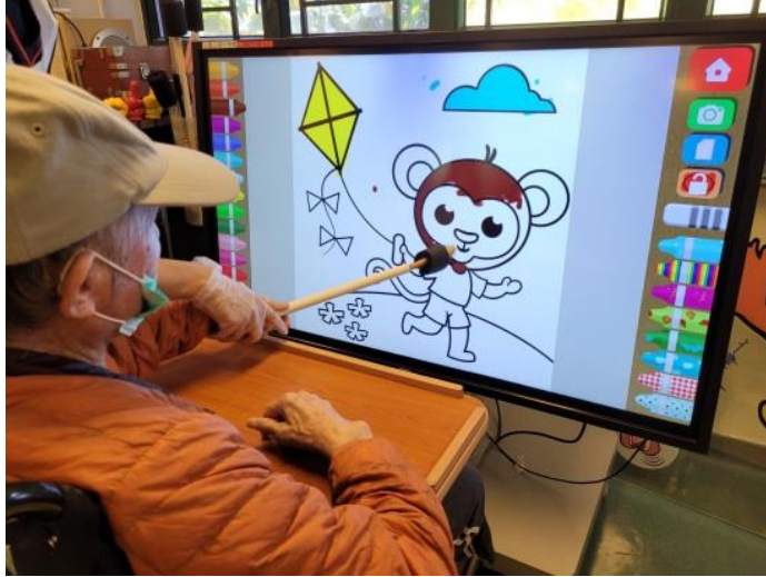
在「大電腦小畫家」的遊戲訓練中，院友運用裝上油漆掃的伸展觸控棒為圖畫添上色彩