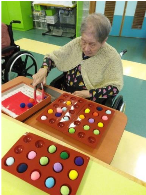
「夾球」是傳統復康訓練之一