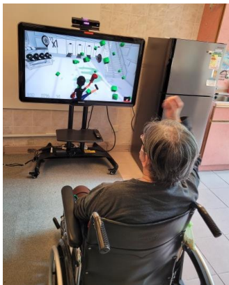
▲ 院友模擬成為拳擊手，逐一擊倒障礙物，樂在其中